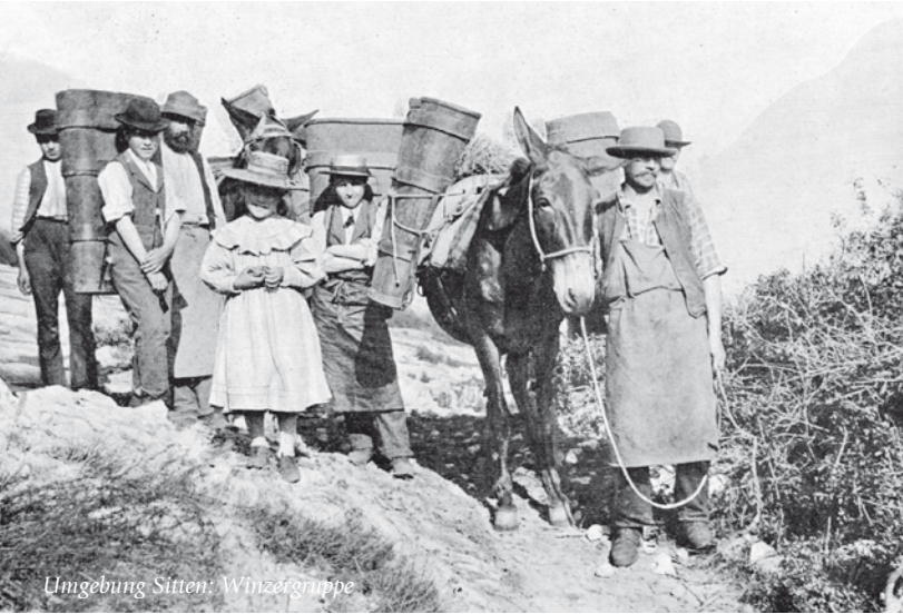
Umgebung Sitten: Winzergruppe

Diese wird ergänzt durch Sonder- und Wanderausstellungen.