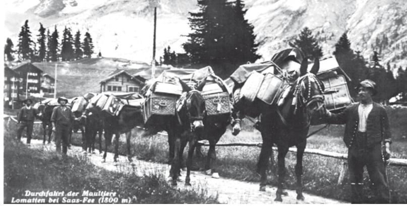
Durchfahrt der Maultiere Lomatten bei Saas-Fee (1600 m)